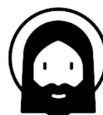
Created by Icon Factory from the Noun Project

Worüber würde sich Jesus in der Kirche heute freuen?